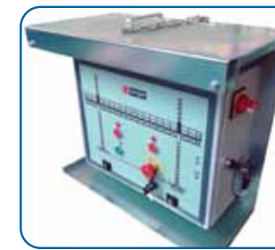
Cuadro de control Control panel