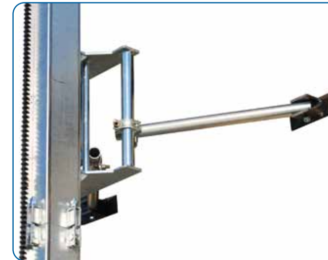
Detalle de arriostamiento Anchoring detail