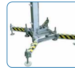
Detalle de la base Base-frame detail