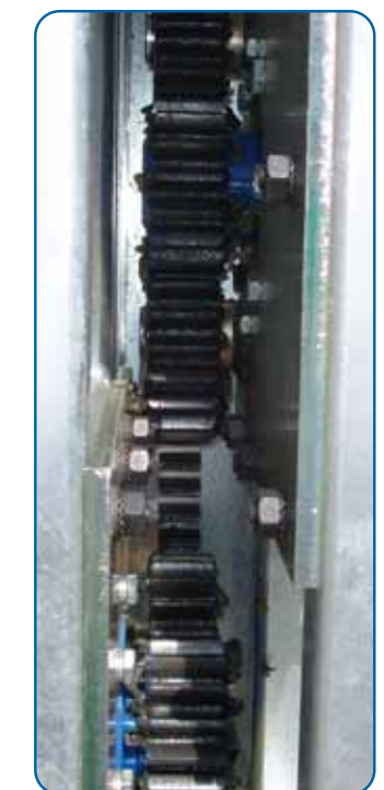
Piñones del grupo motriz y paracaídas Drive unit and overspeed brake pinions

Para mayores longitudes de plataforma o de extensibles, consultar con nuestro Departamento Técnico Ask our Technical Department for special specifications like bigger platform length or longer extensions