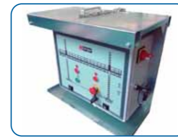
Cuadro de control Control panel