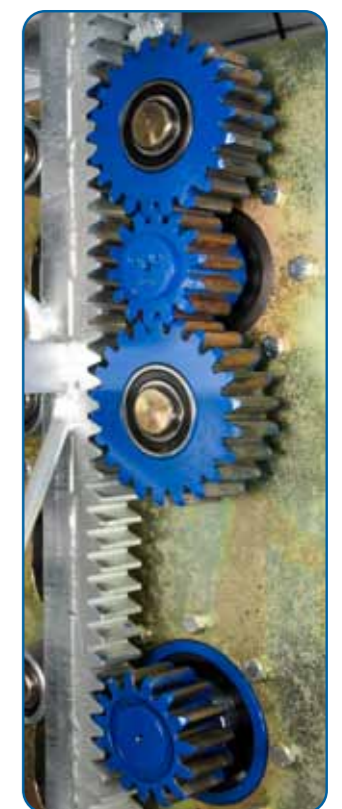
Piñones de grupo motriz y paracaídas Drive unit and overspeed brake pinions

Para mayores longitudes de plataforma o de extensibles, consultar con nuestro Departamento Técnico Ask our Technical Departement for special specifications like longer platform or longer extensions