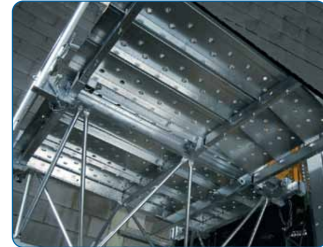
Extensibles con suelo de chapa de acero galvanizado Extensions with galvanized floor plates